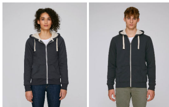
Stella Travels Sherpa Stanley Tours Sherpa